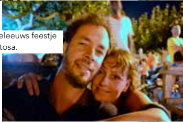
Middeleeuws feestje in Tortosa.

ALS DE HEMEL KNALROZE EN ORANJE KLEURT EN IK AL DIE BLIJE KOPPIES ZIE, VOEL IK ME INTENS GELUKKIG