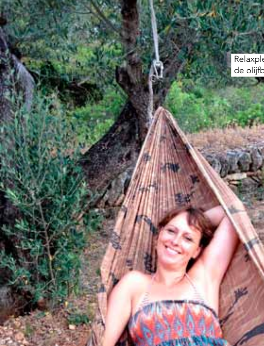
Relaxplek tussen de olijfbomen.