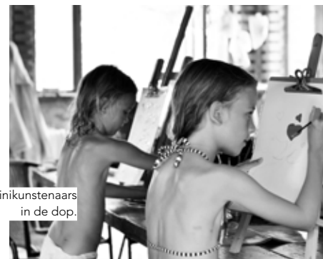
Minikunstenaars in de dop.