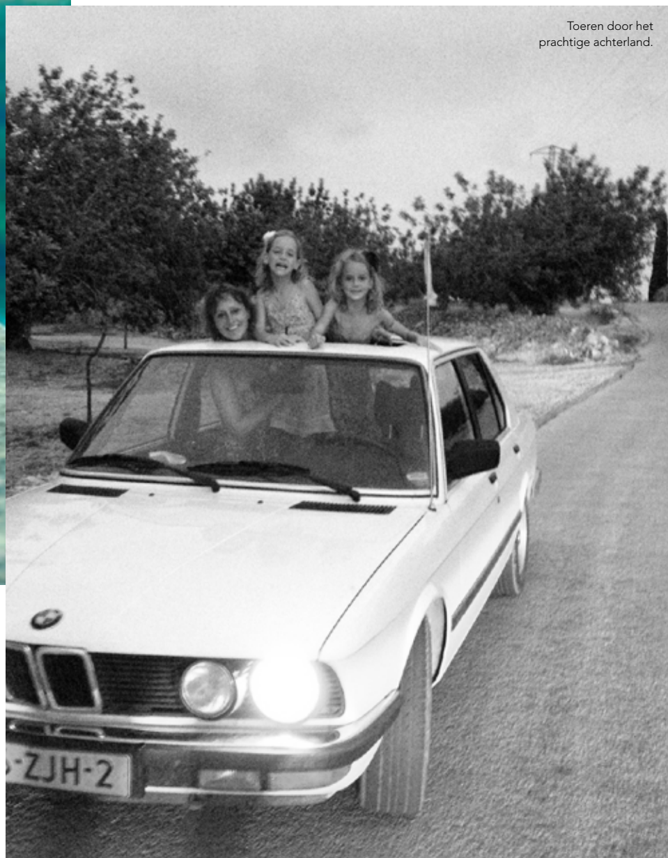
Toeren door het prachtige achterland.

OF DE SAFARIPLAATS MÉT VOLLEDIG INGERICHTE BUNGALOWTENT NOG TWEDE WEKEN VRIJ IS IN JULI? WANT NO WAY DAT IK MIJN HUISRAAD GA MEESLEPEN. ER ZIJN GRENZEN