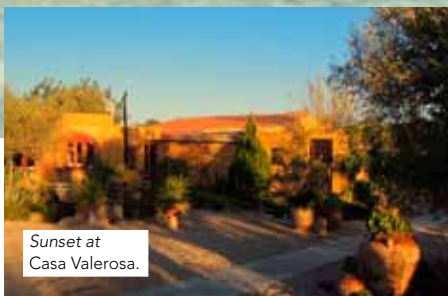
Sunset at Casa Valerosa.

Mijn dochters hebben elkaar. Ik voel me nooit schuldig als we neerstrijken in een of ander van kinderen verlaten oord. Maar sinds ze op