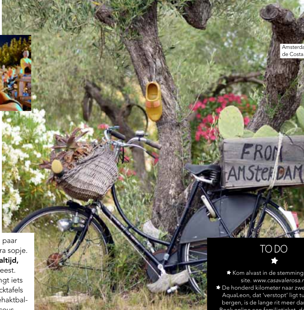
Amsterdam aan de Costa.

ALS DE HEMEL KNALROZE EN ORANJE KLEURT EN IK AL DIE BLIJE KOPPIES ZIE, VOEL IK ME INTENS GELUKKIG