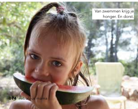
Van zwemmen krijg je honger. En dorst.