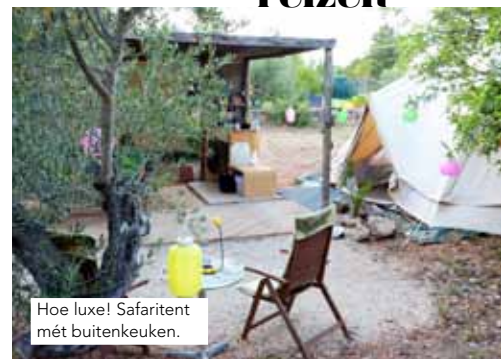
Hoe luxe! Safaritent mét buitenkeuken.

Ruim 1.700 kilometer enkele reis is pittig , maar goed te doen van bed & breakfast naar chambre d'hôtes. Marvy en Pippa, beiden in bezit van een koffer vol vermaak, klagen niet. We strekken regelmatig de benen en aan het einde van elke reisdag wacht een zwembad. Na vier dagen bereiken we El Perelló, het dorpje waar Valerie enkele jaren geleden neerstreek. Als we na een slingerweg langs olijfgaarden een stoeltje met het bordje Casa Valerosa zien, klinkt er gejuich vanaf de achterbank. We worden onthaald door een roedel blaffende honden