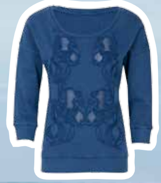
Sweater € 39,95 (Shoebly).