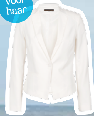
Blazer € 59,95 (Shoebly).