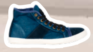
Sneakers € 39,95 (Shoebly).