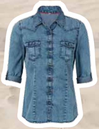
Denim blouse € 29,95 (Shoebly).