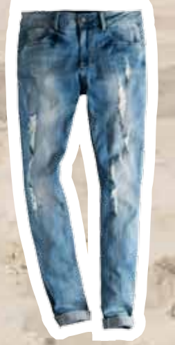
Jeans € 49,95 (Shoebly).