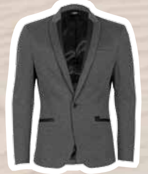
Colbert € 79,95 (Shoebly).

tekst: petra schouten. fotografie: sanne tulp. assistenten: kim verspui en judith nietveld. styling: miriam jesajtes. haar en make-up: sabrina dijkman. voor-verkoopinformatie zie inhoud.