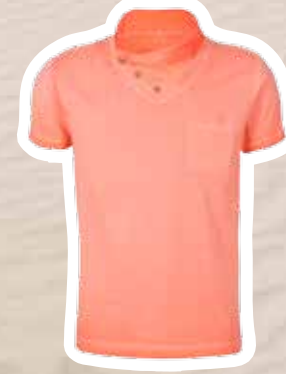
T-shirt € 17,95 (Shoebly).