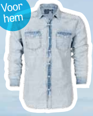
Denim shirt € 49,95 (Shoebly).