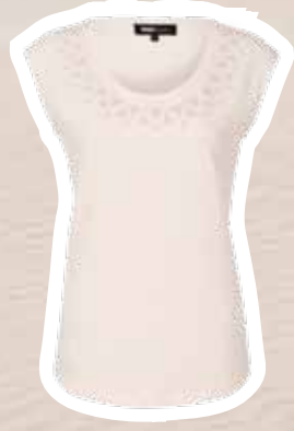
T-shirt € 24,95 (Shoebly).