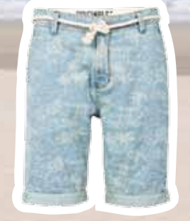
Short met dessin € 49,95 (Shoebly).