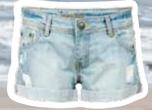
Shorts € 29,95 (Shoebly).