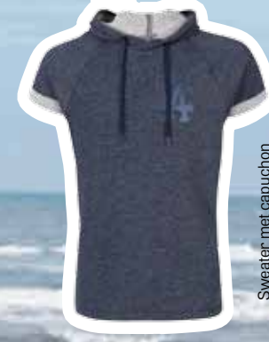
Sweater met capuchon € 29,95 (Shoebly).