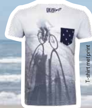
T-shirt met print € 19,95 (Shoebly).