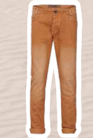
Broek € 39,95 (Shoebly).