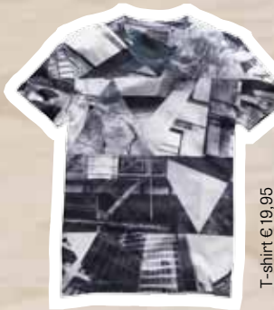
T-shirt € 19,95 (Shoebly).