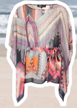
Kaftan € 29,95 (Shoebly).