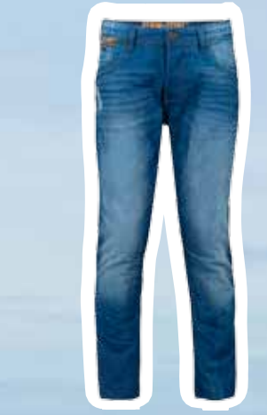
Jeans € 59,95 (Shoebly).